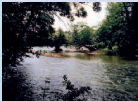
Das ist der ASA wichtig: natürliche Lebensräume für Menschen, Tiere und Pflanzen!

Um dies zu verhindern, wurde 1964 die ASA gegründet. Ihr Ziel war es, die Aare vom Bielersee bis zur Mündung in den Rhein in ihrem natürlichen Zustand zu bewahren.