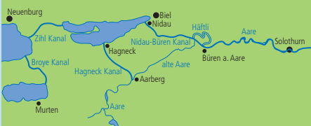
(Grafiken: Markus Capirone)